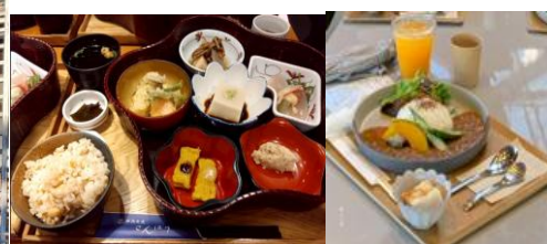
精進料理・精進カレー